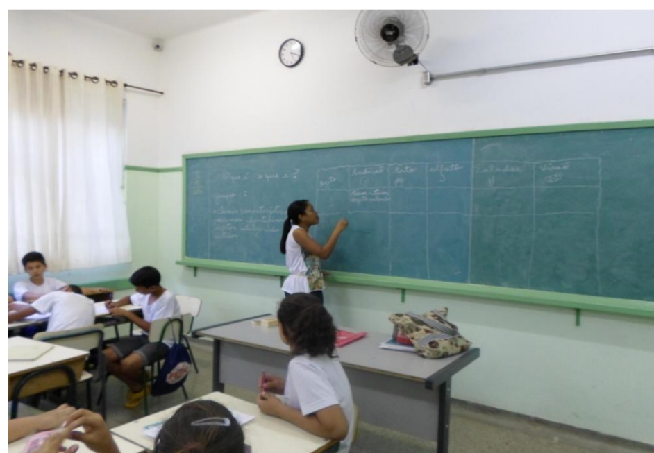
Figura 1. Mostra como foi construída a tabela

A classe foi dividida em grupos e orientada a construírem uma tabela com seis colunas, sendo cinco colunas para inserir o nome dos cinco sentidos e uma coluna utilizada para inserir o nome do objeto investigado, como mostra a figura 1.